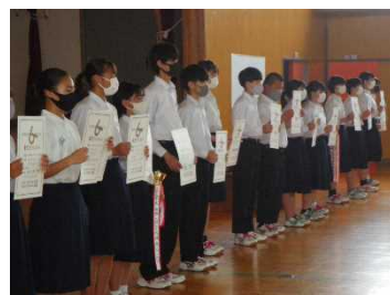
各部の代表からの結果報告と表彰。堂々とした発表！そして多くの入賞！～報告会（6/28朝）～